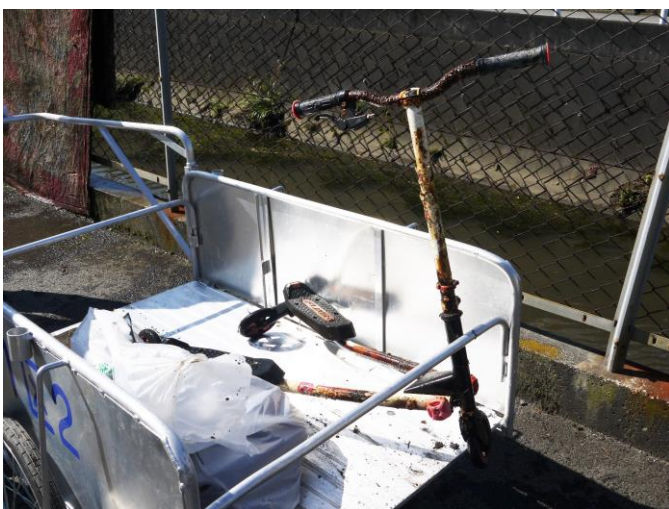
不法投棄物もあり、清掃活動をしている方からは、「こんな捨てるのは日本人じゃない。」といった声も聞こえました。