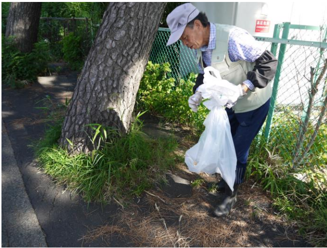
河川の周りも清掃しました。