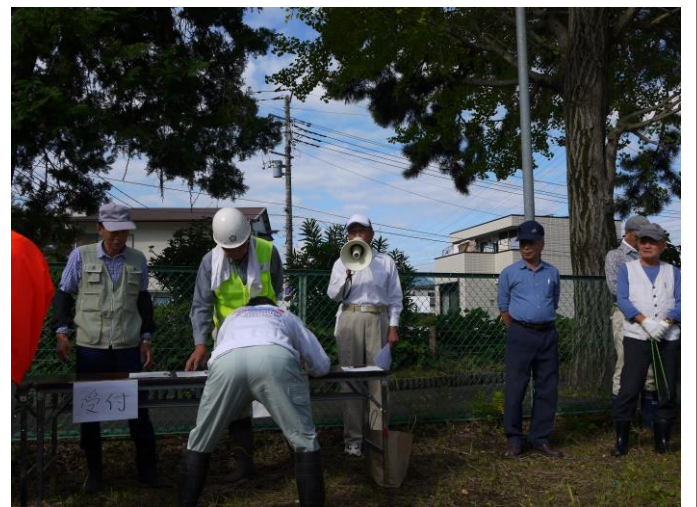
星崎副委員長（河川美化分科会長）より作業の流れの説明