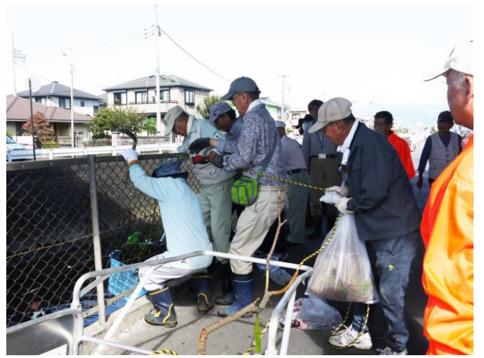
川のごみを籠に入れて、上にいる方が引き上げます。