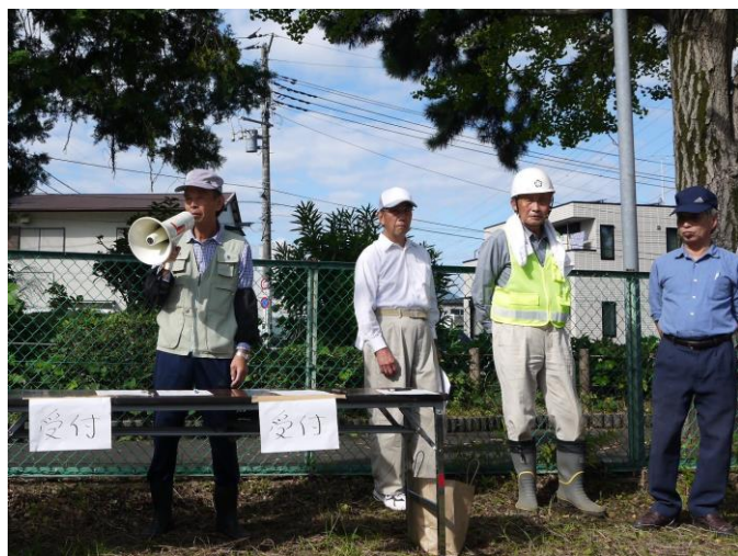
秋山委員長より開会のあいさつ