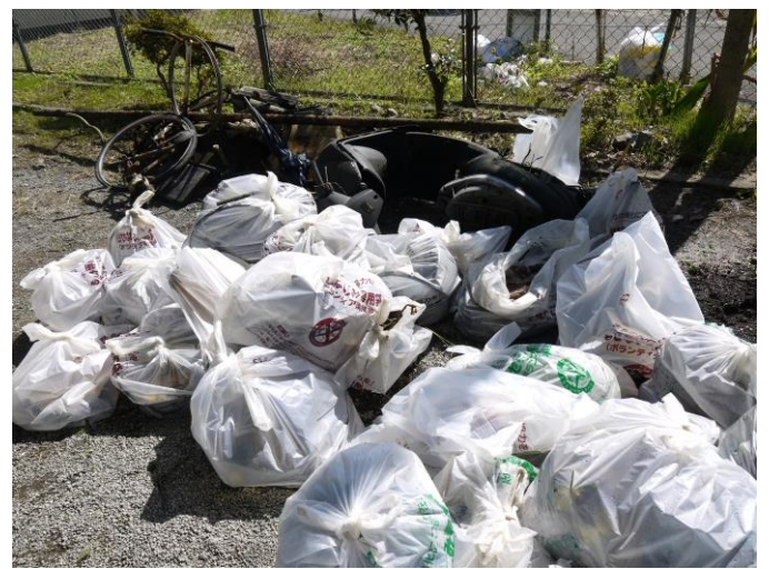
集積所の様子（集積所は4箇所）