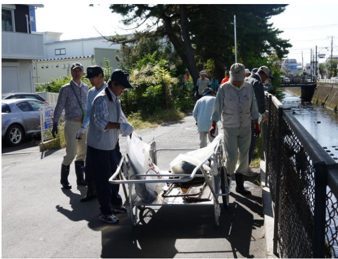
川から出たごみは、集積所までリアカーで運びました。