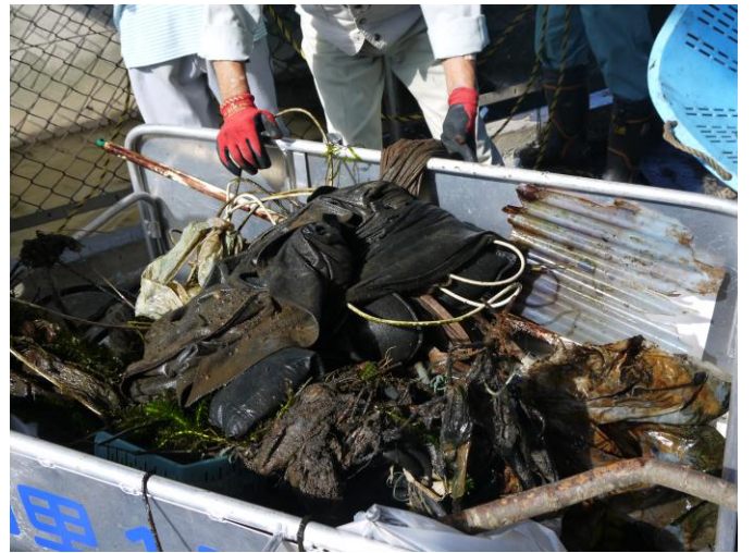
清掃時間は、1時間を予定していましたが、予想以上にゴミの量が多かったため、30分延長して行いました。