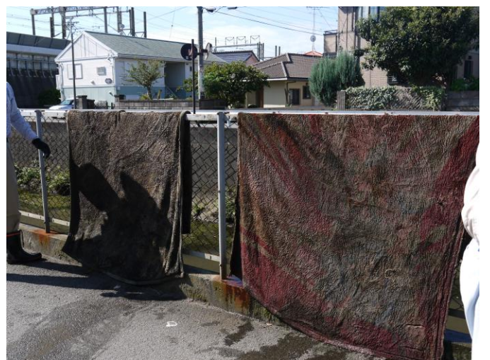
毛布や布団がたくさん捨ててありました。毛布は水を含んでいたため、乾かしてから回収しました。