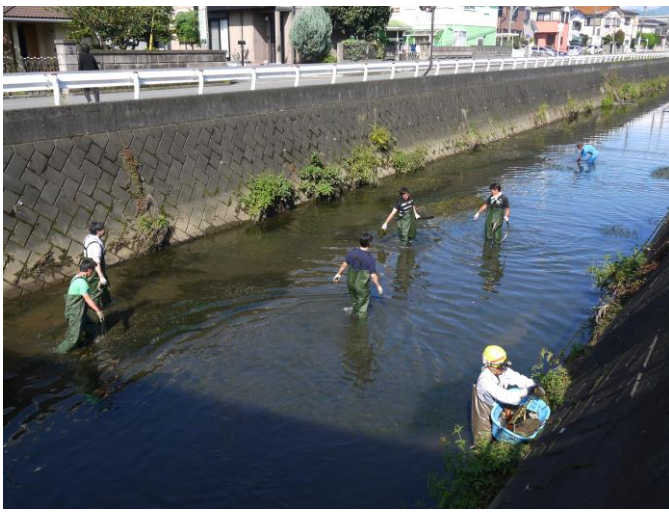
洞付き長靴を着用し、川の中へ入って清掃しました。