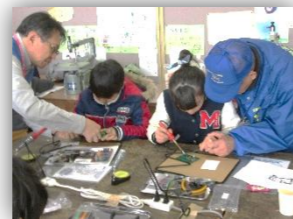
みんな真剣に作業中！ 完成。聞こえたよ！

当日は、神奈川県電波適正利用推進協議会、メリットファイブメンバーズHAMクラブの皆さんが子どもたち一人ひとりにラジオ作りを丁寧に指導して下さり、子どもたちも慎重にハンダごてを基盤に当て、熱心に細かい作業に取り組んでいました。参加した小学生に感想を聞くと「音が聞こえた時はうれしかった。また参加したい」と笑顔で話してくれました。