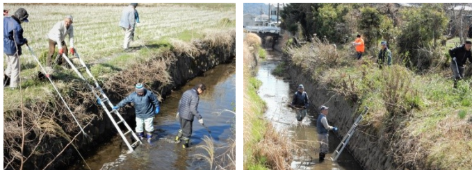
上流清掃 ・ 草刈り