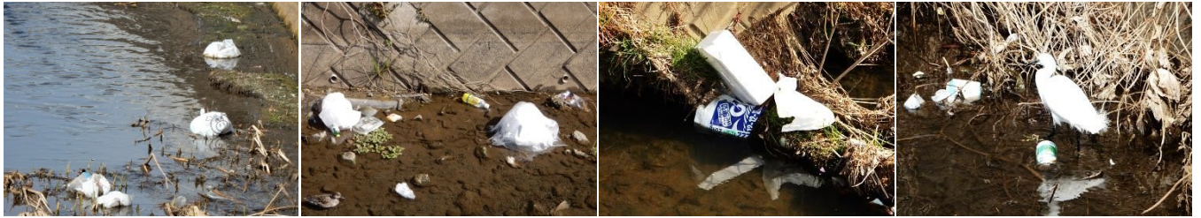
ゴミ ・ ゴミ ・ ゴミの投げ捨て

3月17日（土）に、まちづくり委員会の委員、市議会議員、市の地域政策課と道水路整備課の職員、消防団第19分団員、永塚の自治会役員、生産組合員など総勢約60名で、山岸川、森戸川に投棄されたラジカセ、大型バッテリー、ガードレール等の不法投棄物の回収や雑木の伐採、草刈り等を行いました。回収した量は、燃えるゴミ、燃せないゴミ等を合わせるとゴミ袋約250袋強でした。量の多さに驚きです。環境保護のためカワセミ等の生息する場所を確保することにより、次世代の担い手に引き継ぐことが出来るのではないかと思います。