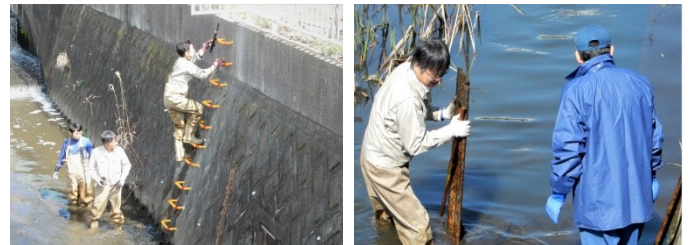
下流清掃 ・ ガードレール回収