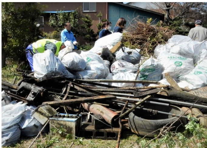
回収したタイヤ・バッテリーなど