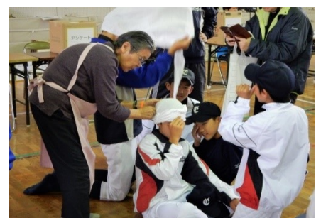
防災訓練への参加