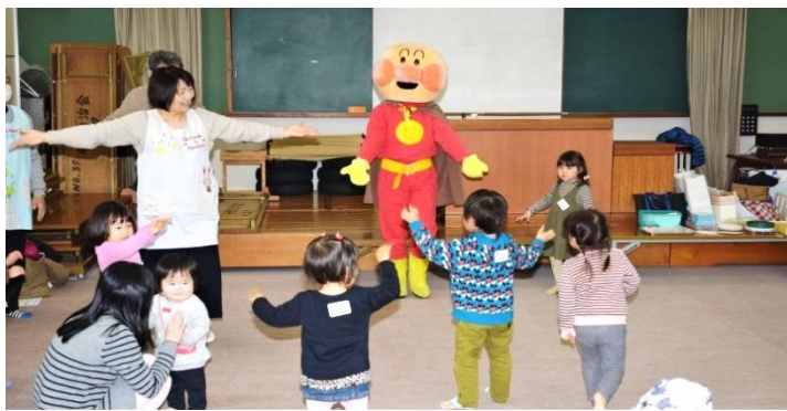
アンパンマンと踊ろう