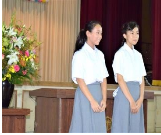
中学生ボランティア

平成三十年九月九日の日曜日、地域の発展に尽くしてこられた高齢者を敬愛し、長寿をお祝いするために開催されている上府中地区敬老会が千代小学校体育館で盛大に開催されました。 今年度から敬老行事の対象となる方の年齢が七十六歳以上から七十七歳以上に変更になり、対象となる方は九百四十一名で前年よりも五十三名減少しましたが、百七十四名の方に出席していただきました。