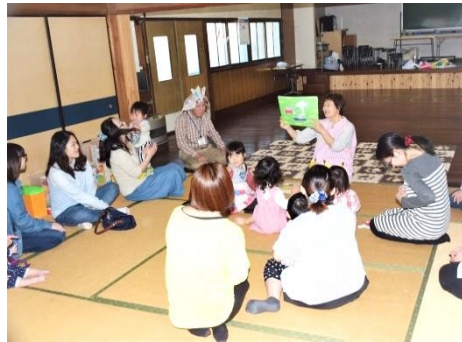
子育てアドバイザーの話