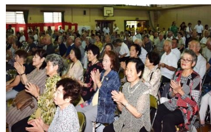
ブラスバンドの演奏に 拍手子

演芸の部の千代小学校三年生の合唱、合奏では、お年寄りとの交流やふれあいに工夫され、高齢者への尊敬の念を深めるような素晴らしい内容でした。