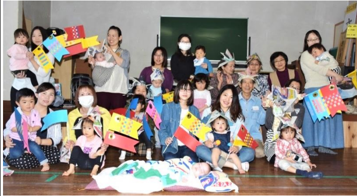
お年寄りと一緒に作りました