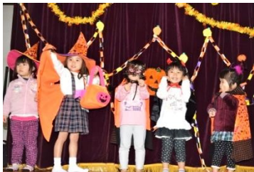
ハロウィンで楽しく