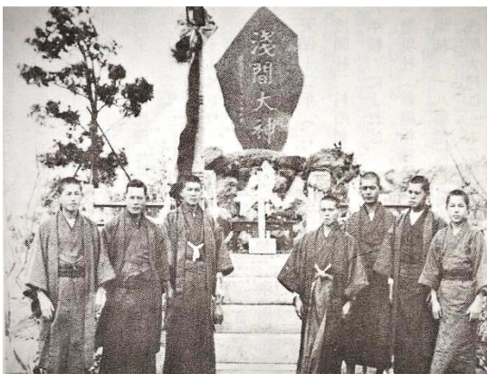
昭和三年四月一日 建立時の様子