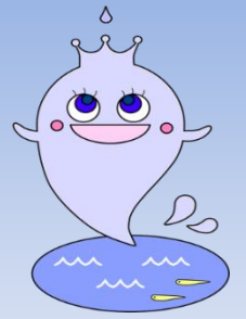
当会キャラクター とみびよん

議事では平成30年度の事業報告・会計報告及び監査報告と、会則の変更・役員・委員の改選・市との協定、平成31年度事業計画・予算が審議されて、すべての議案は満場一致で承認されました。