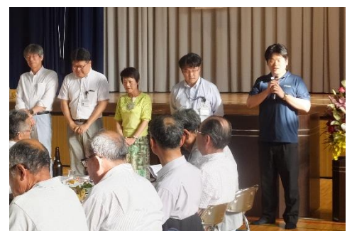
小田原市地域政策課のみなさん