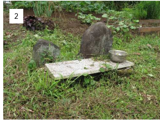
歩いていくと、道の脇の道祖神と出会う。この場所で毎年正月に久所自治会の“どんど焼き”が行われている。