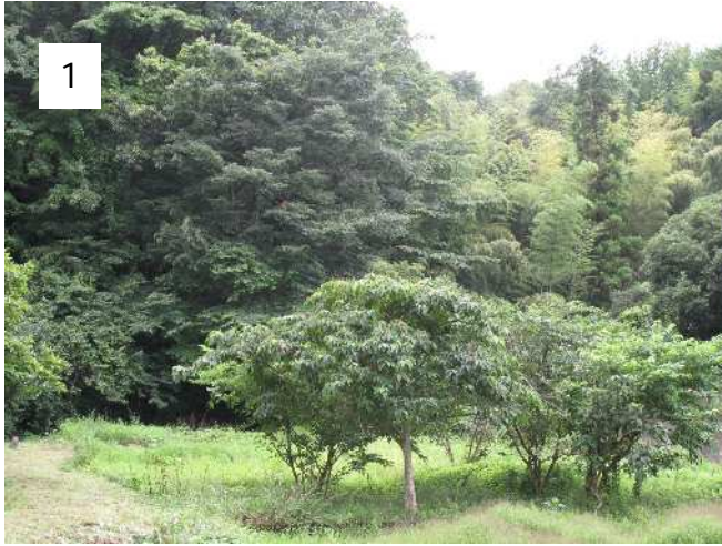
脇道から泉のある崖を眺める。山の向こうは県立公園。一帯は湿原状態になっている。道の左脇に道祖神が小さく見える。