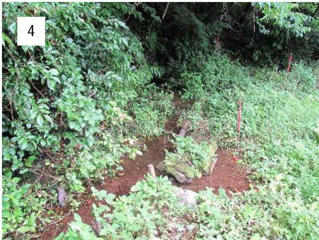
崖の麓から流れ出る小川。水は向かって左側と右側に流れ出ている。右側に流れた水が付近を湿原状態にしている。ここで生まれたホタルは近くの住宅地まで飛来する。