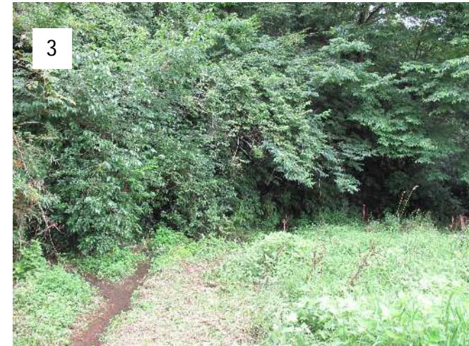
きれいな小さい流れが2つ合流して脇道の左側を流れている。一本は左の林の中から、もう一本は右側の崖の麓から。季節になると、ホタルがこのあたりで乱舞する。