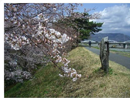
守り続ける桜の木