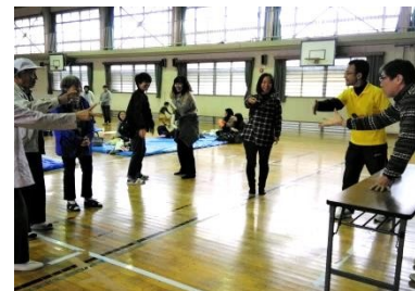
ジャンケンポン大会