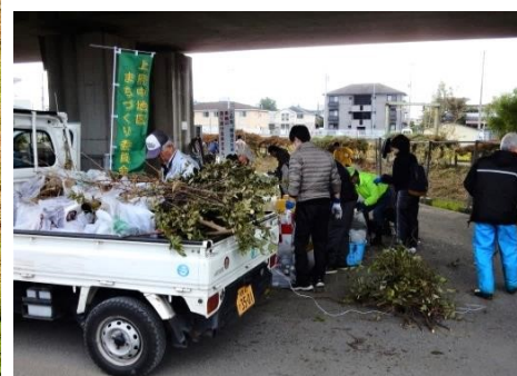
軽トラックで回収