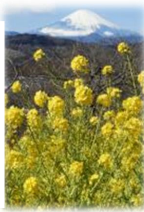
2/12 体育振興会 吾妻山ハイキングより