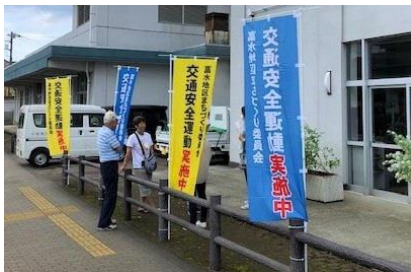
富水小学校の沿道