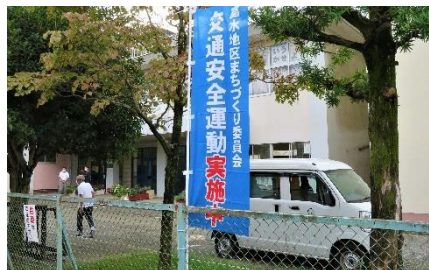
泉中学校の正門付近