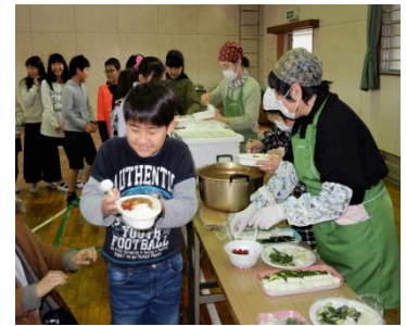
大盛りカレーに嬉しそう