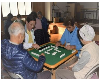
いきいきふれあいサロン高田

各地区で、ヨガ体操、フルーツやギター演奏、大正琴演奏で歌を歌う、クリスマス会等工夫を凝らしての内容は、大変盛り上がり、参加される方もだんだん増えております。また、地区を超えて参加されている方が、かなり見受けられることから交流が更に深まっていると思われます。