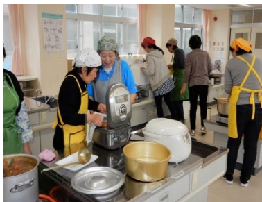
朝早くからカレー作り