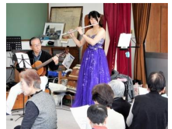
ひだまりサロン・ちよ