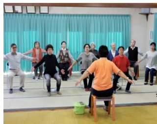
ゆったりサロン永塚