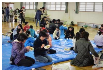
美味しかったです