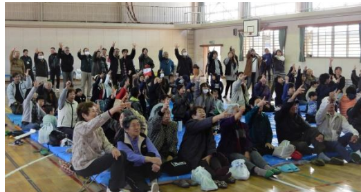
ジャンケンポン・絶対勝つぞ