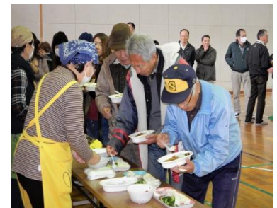
大人も順番に並んで