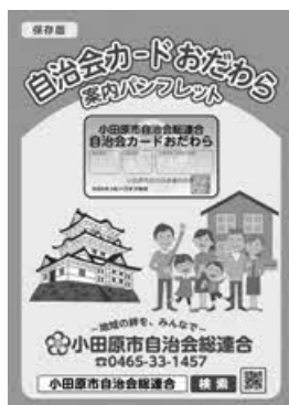
▶協力店舗 案内パンフレット