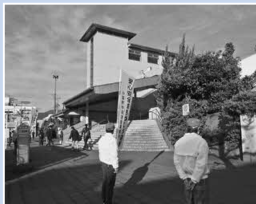
▲鴨宮駅でのあいさつ運動