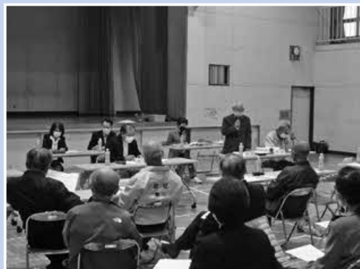
▲豊川地区での地域活動懇談会の様子

どの地区においても、参加した地域コミュニティ組織の委員のかたから、防災や教育、環境など地域の様々な課題への意見が活発に出されています。