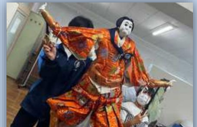
小竹で三百年の伝統を守り続ける下中座

小学生から80代の方までどなたでも入会できるそうです。皆さんも見学してみたいはいかがでしょうか。