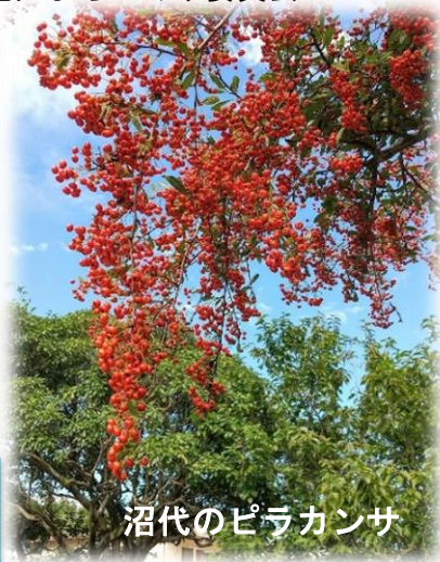
沼代のピラカンサ