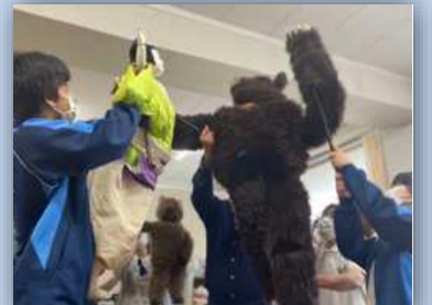
金太郎に豪快に投げ飛ばされる熊