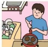
障がいや病気のある家族に代わり、買い物・料理・掃除・洗濯などの家事をしている