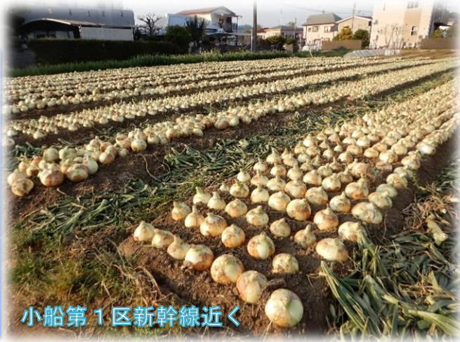
小船第1区新幹線近く