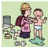
家族に代わり、幼いきょうだいの世話をしている