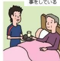
がん・難病・精神疾患など慢性的な病気の家族の看病をしている