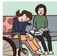
障がいや病気のあるきょうだいの世話や見守りをしている