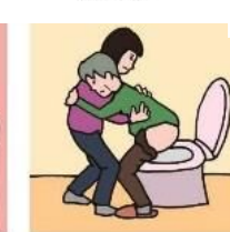
障がいや病気のある家族の入浴やトイレの介助をしている

Illustration : Izumi Shiga