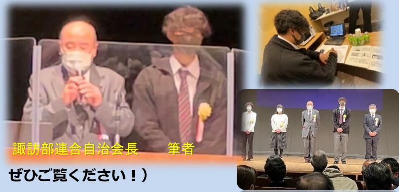
諏訪部連合自治会長 筆者