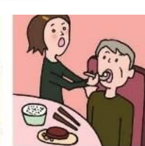
障がいや病気のある家族の身の回りの世話をしている