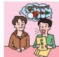
日本語が第一言語でない家族や障がいのある家族のために通訳をしている