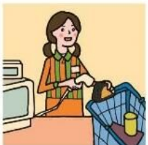
家計を支えるために労働をして、障がいや病気のある家族を助けている