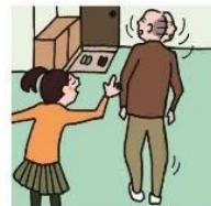
目を離せない家族の見守りや声かけなどの気づかいをしている