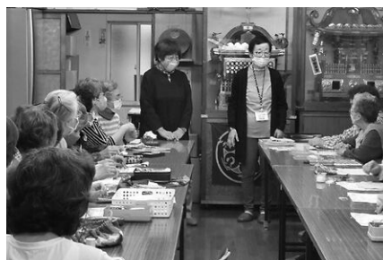
サロンしおざる(万年)