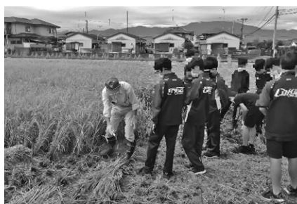
農業体験学習(上府中)