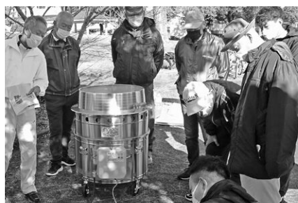
防災資機材取扱い訓練(富士見)