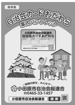
◀協力店舗案内パンフレット