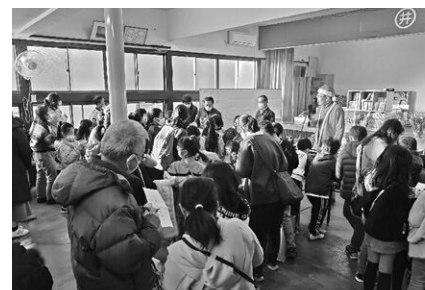
めぞん足柄クリスマス会(二川)