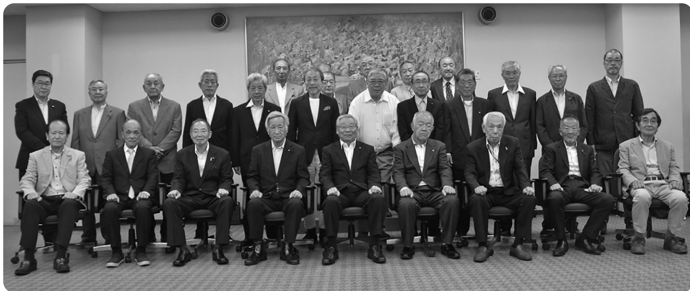
小田原市自治会総連合 連合会長26名

今後も「住みよいまちは自治会から」を心がけ、地域の皆さんと一緒に安全安心なまちづくりを推進してまいりますので、変わらぬご支援ご協力を賜りますようお願い申し上げます。