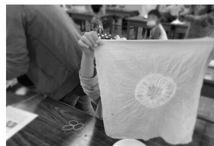
下中たまねぎ草木染体験(橘北)