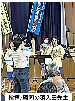
指揮/顧問の羽入田先生