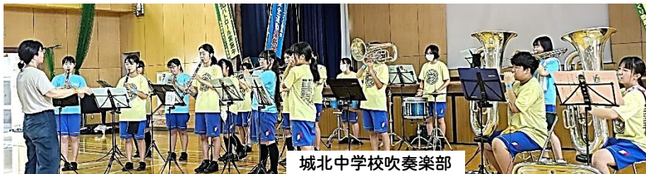
城北中学校吹奏楽部

スペシャルゲストとして、今年是小田原市立城北中学校吹奏楽部にご出演をいただき、ワンピースのウィーアー!などパワフルな演奏を披露していただきました。途中1年生によるダンスも加わり、会場からの万雷の手拍子で盛り上がりました。久しぶりに若返った気分になりました。