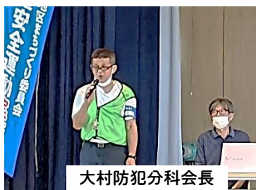
大村防犯分科会長

小田原警察署生活安全課の本郷課長さんから、特殊詐欺の最新手口についてお話しを伺い、そのあと防犯分科会によるアポ電強盗の寸劇を見ました。アポ電強盗とは、「ルフィー」の名前で一躍有名になった強盗団の手口で、新手的侵入犯罪です。寸劇では「命を脅かされる怖さ」を感じました。また最近では、市役所、警察、消防等の公的機関の職員を装って、①ATM操作による現金振り込み要求、②レターパック・宅急便で現金送付要求、③カード・通帳の預かりを行う詐欺が目立つそうです。詐欺に遭わないためには①お金の話が出たら詐欺と思うこと。②自宅電話は留守電に設定すること。これらが効果絶大とのお話しでした。