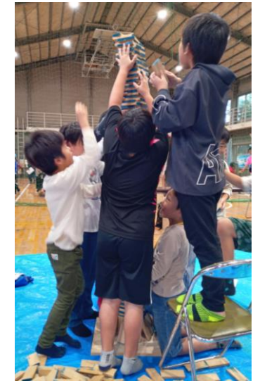
遊具（かまぼこ板タワー）