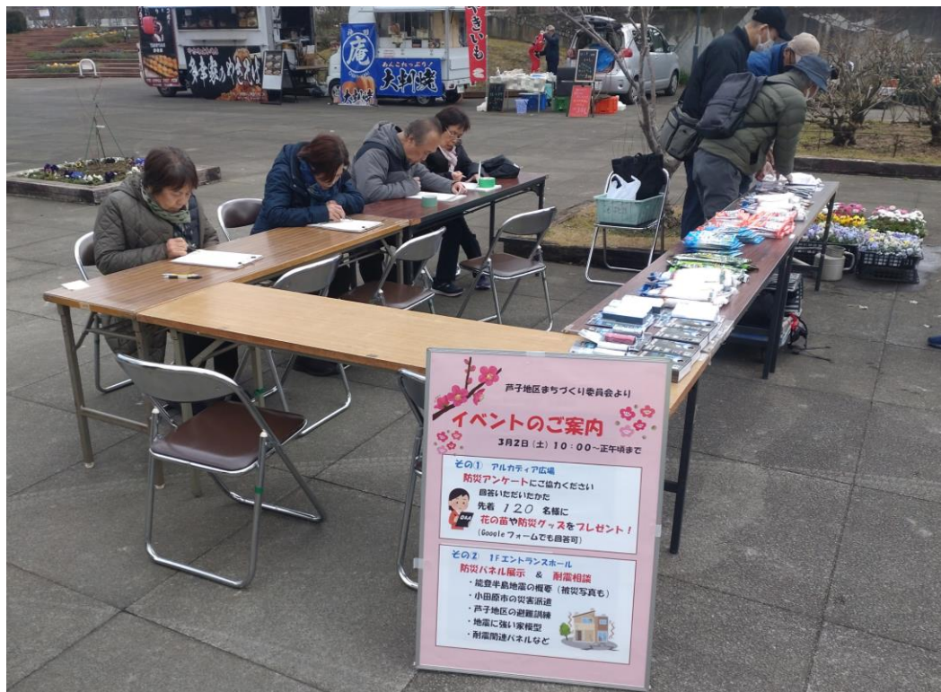
フラワーガーデン主催の防災フェアにて 防災に関するアンケートの実施 (R5)