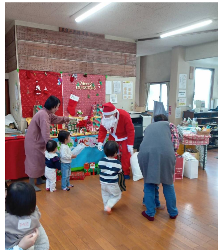
子育てサロンの クリスマスイベント