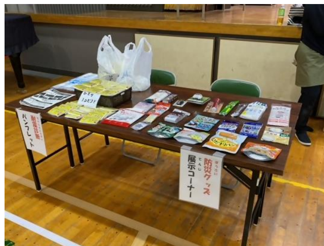
防災グッズの展示