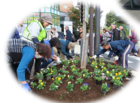
Cグループ（地域振興）