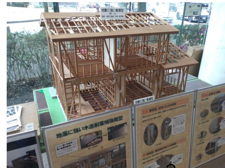
パネル展示 木造住宅耐震相談