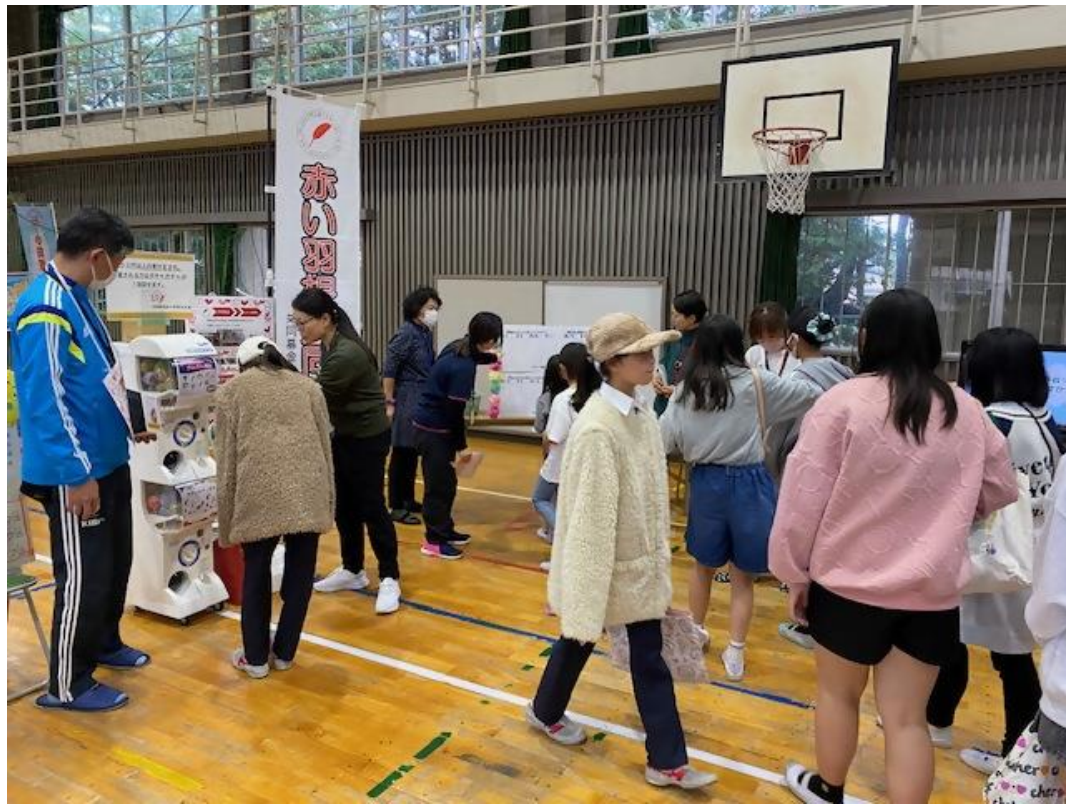
芦子小ふれあいフェスタへの ブース出展