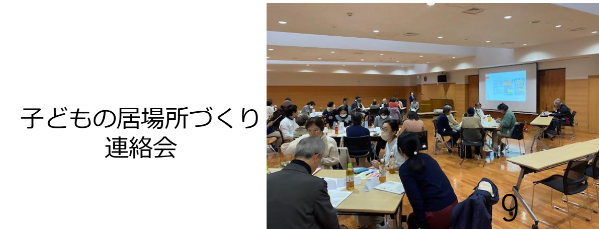
子どもの居場所づくり連絡会