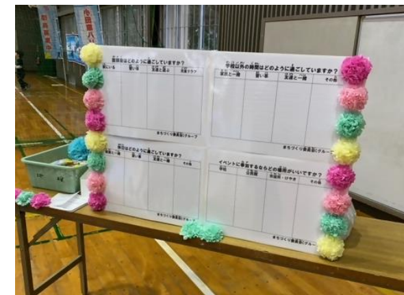
居場所に関するアンケートの実施 10