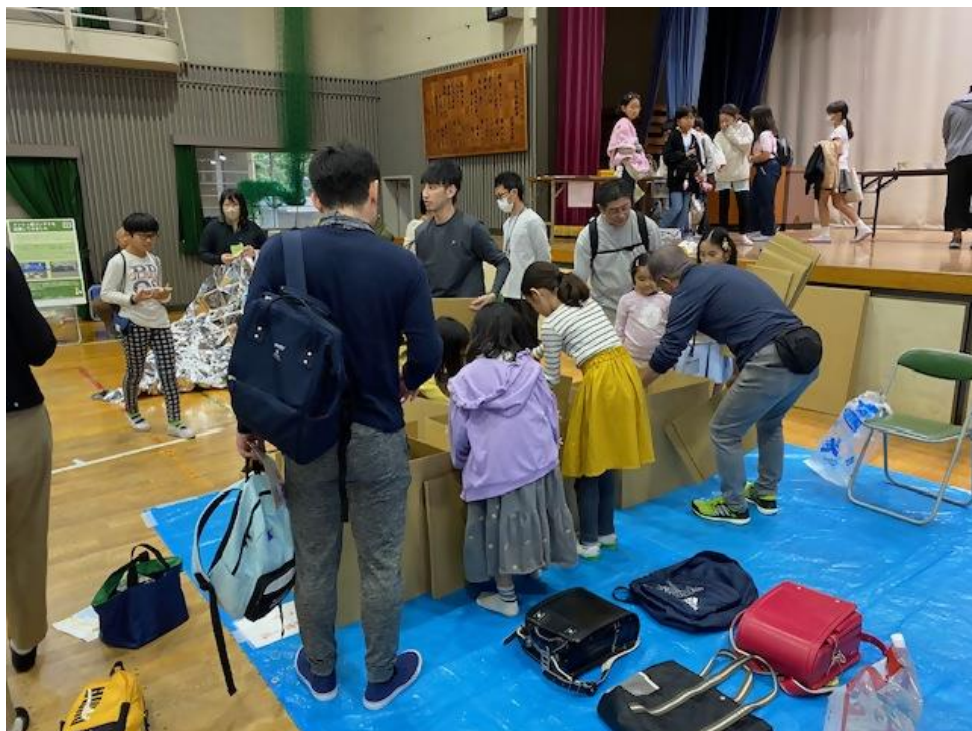
芦子小ふれあいフェスタへの ブース出展