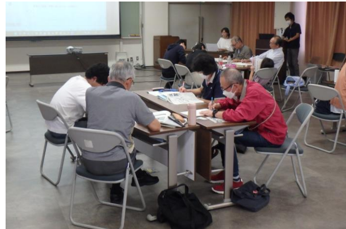
担い手育成・発掘支援講座