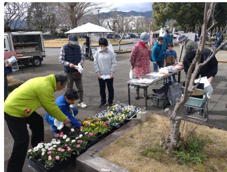
アンケート回答者にお礼の品を贈呈