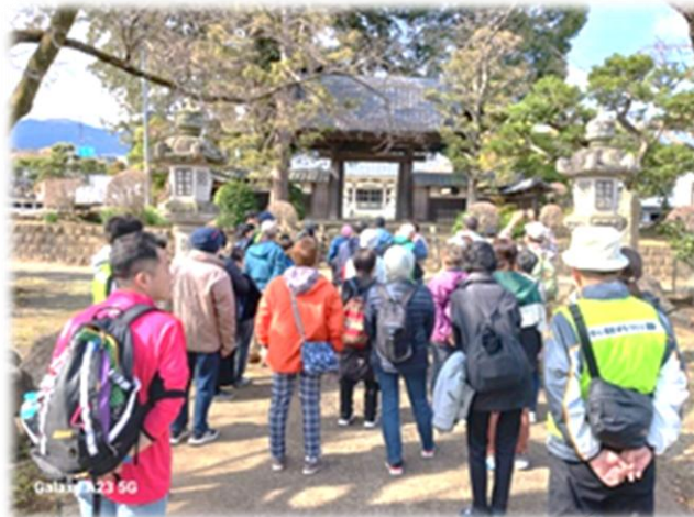
▲総世寺山門前の様子