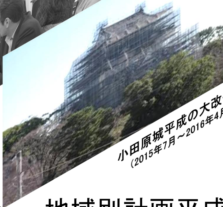
小田原城平成の大改修 (2015年7月～2016年4月)