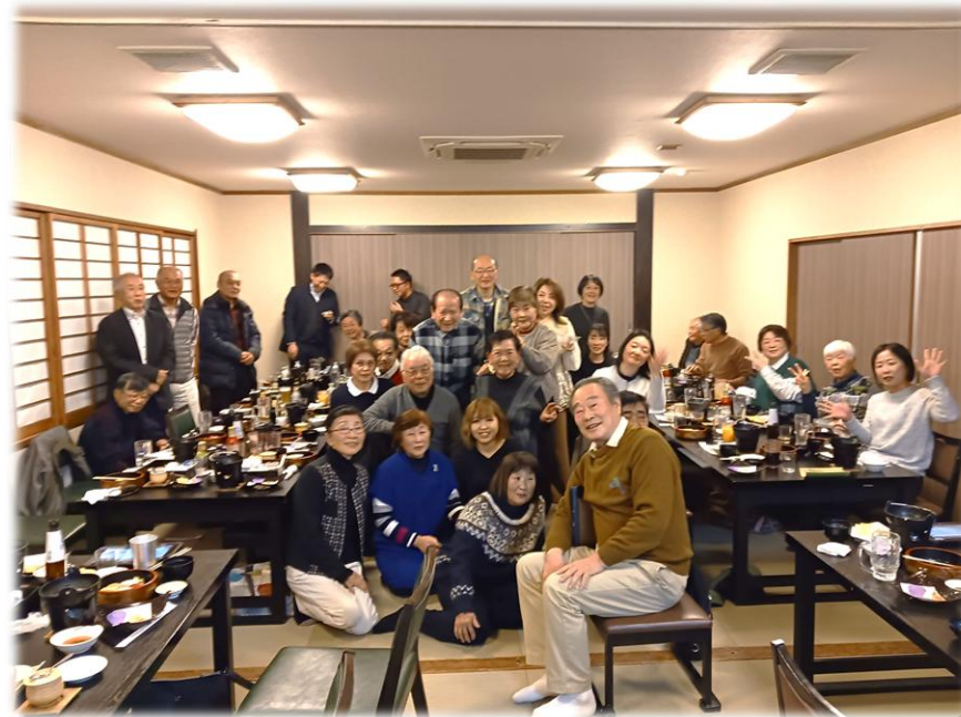
▲ 3者交流会の様子（自治会、民生委員児童委員協議会、社会福祉協議会）