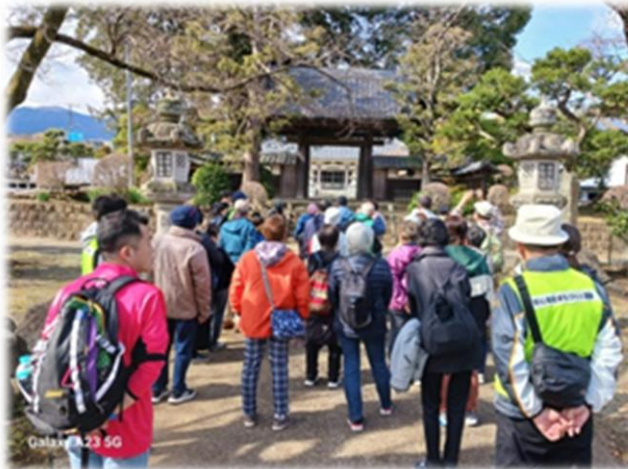
▲総世寺山門前の様子