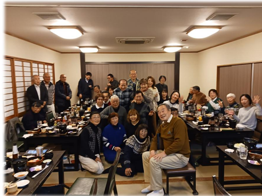
▲ 3者交流会の様子（自治会、民生委員児童委員協議会、社会福祉協議会）