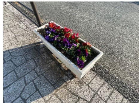
プランターにも花を植えました。