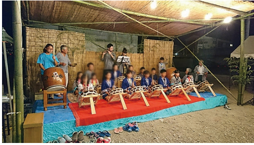
お囃子保存会の演奏