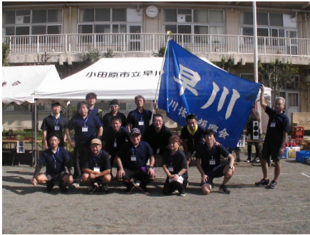
体育振興会のみなさん