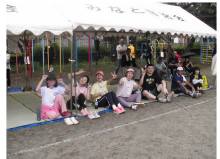
応援団のみなさん