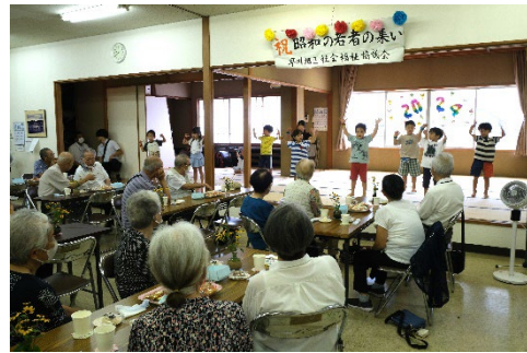
↑「昭和の若者のつ どい」にて早川保育 園の子ども達が踊り を披露しました。