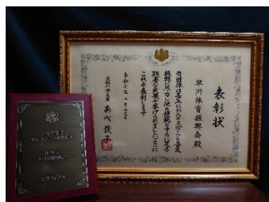
表彰状と記念の盾