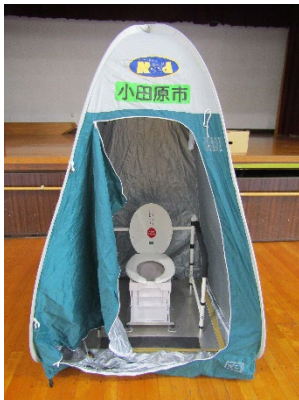
仮設トイレ組立訓練