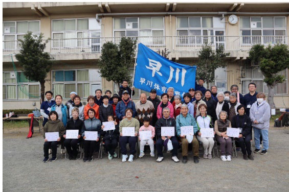
参加者のみなさん