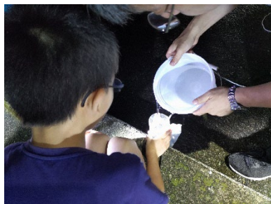
漁港でプランクトン採取