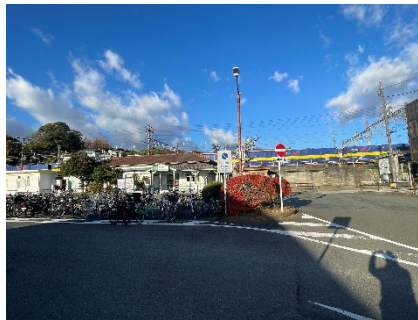
駐輪場周りは行政で作業しました。