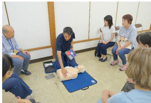
←小田原消防の方々と救命 講習会を行いました。