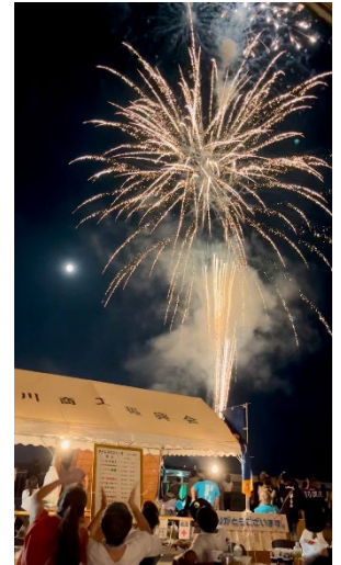
恒例の花火も上がります。⇒