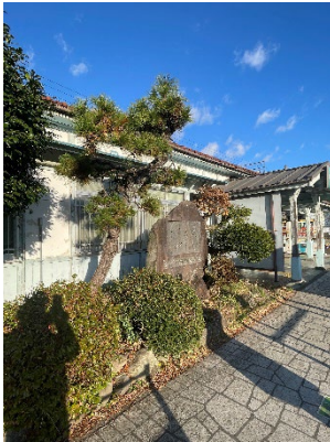
駅前がきれいになりました。