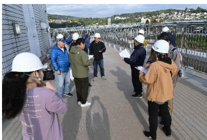
みなと自治会一時避難場所 (小田原水産合同庁舎屋上)