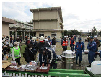
炊き出し訓練 (まかない君)