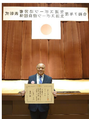
受賞後の青木会長