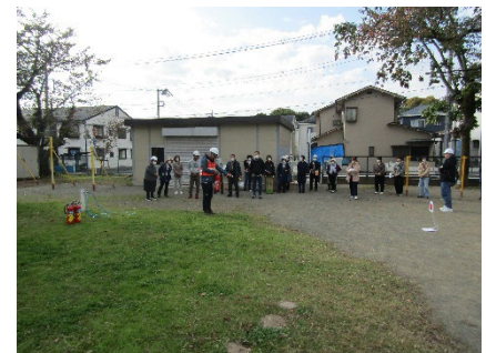
木地挽自治会一時避難場所 (早川小学校校庭)