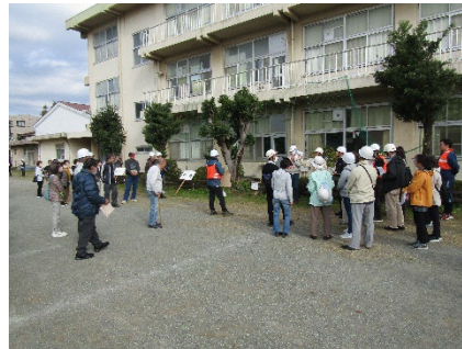
自治会連合会長挨拶