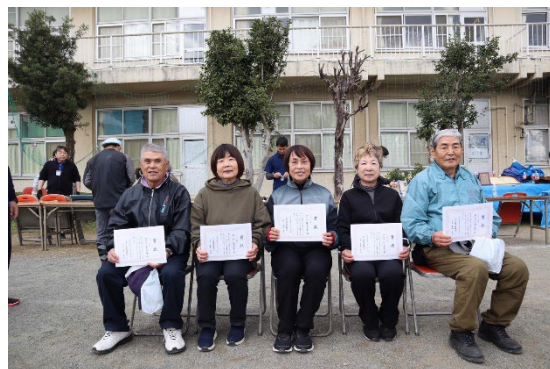
入賞者のみなさん