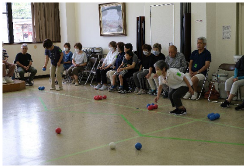
↑研修委員会にて 「ポッチャ大会」を 開催しました。