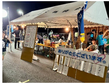
様々なお店が並びます。