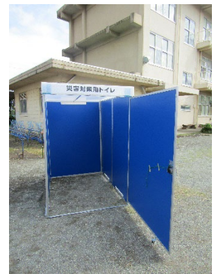
マンホールトイレ組立訓練