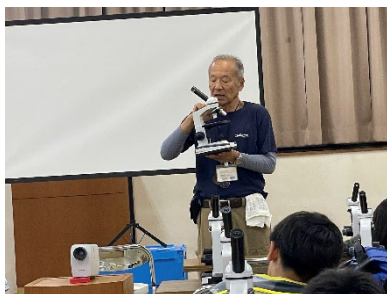
公民館で説明を聞く