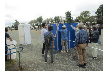
マンホールトイレ組立訓練